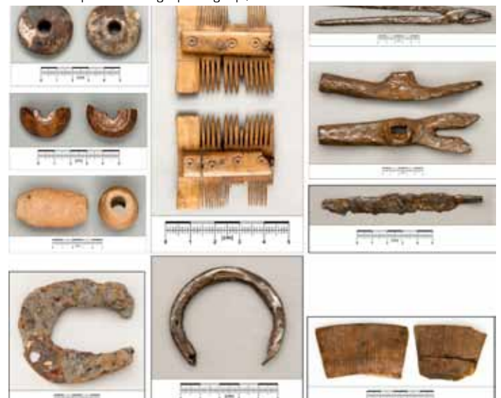
Zabytki wydzielone, w tym m.in. podkowy i narzędzie kowalskie.