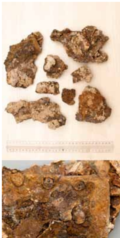
Fragmety zbroi płytkowej.