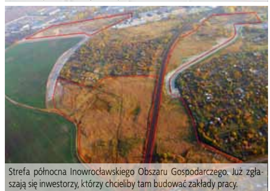
Strefa północna Inowrocławskiego Obszaru Gospodarczego. Już zgłaszają się inwestorzy, którzy chcieliby tam budować zakłady pracy.