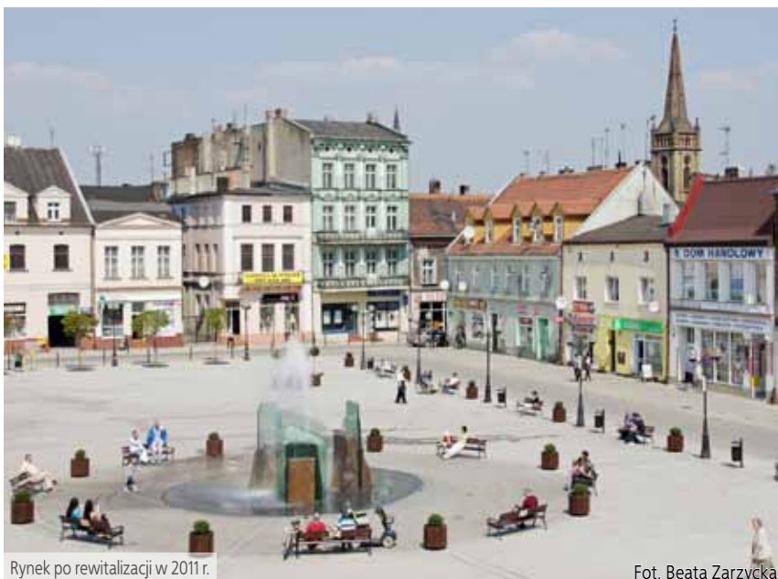
Rynek po rewitalizacji w 2011 r.