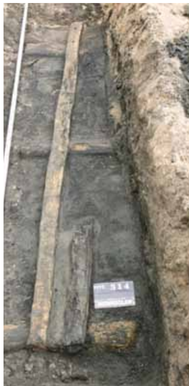
Relikty ciągów komunikacyjnych.