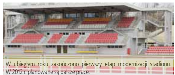
W ubiegłym roku zakończono pierwszy etap modernizacji stadionu. W 2012 r. planowane są dalsze prace.