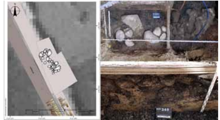
Pozostałości Bramy Bydgoskiej (rys. T. Górzyński).