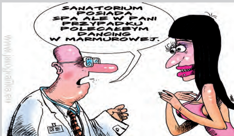
Rys. Jarosław Wojtański