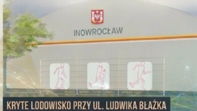
KRYTE LODOWISKO PRZY UL. LUDWIKA BŁAŻKA