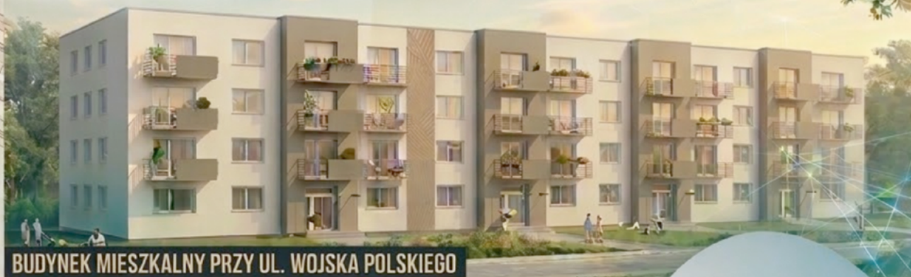
BUDYNEK MIESZKALNY PRZY UL. WOJSKA POLSKIEGO