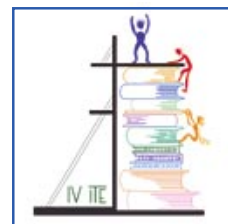
Znak graficzny IV ITE.