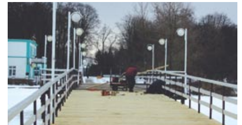
Remont mostku w Parku Solankowym.

Ponadto wznowione zostaną prace dotyczące zagospodarowania terenu przy budynkach przy ulicy 59 Pułku Piechoty. W trakcie realizacji jest remont mostku w Parku Solankowym oraz budowa budynku socjalnego przy ulicy Wojska Polskiego.