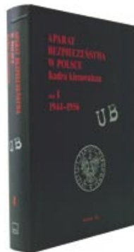
Pełny wykaz funkcjonariuszy UB zawarto w książce „Aparat bezpieczeństwa w Polsce. Kadra kierownicza”, t. I 1944-1956, Warszawa 2005 r.