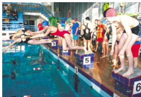
Fotograficzna migawka z zawodów na basenie.

Sportowym akcentem były natomiast imieninowe zawody pływackie o Puchar Miasta Inowrocławia, które odbyły się na krytej pływalni „Delfin”. Zawody wygrała drużyna reprezentująca Osiedle Toruńskie.