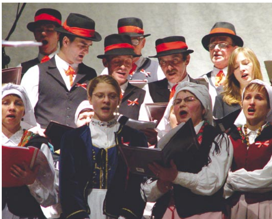
„Kolędarium Polskie” wystawiono w Teatrze Miejskim.