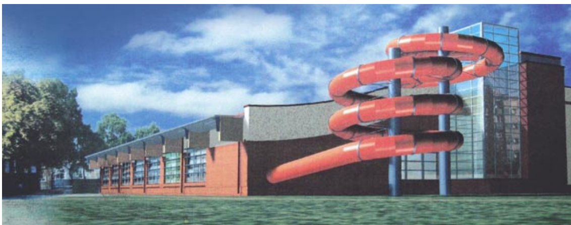
Zgodnie z koncepcją architektoniczną tak będzie wyglądać budynek pływalni od strony zjeżdżalni...

– O wyborze oferty w siedemdziesięciu procentach decydowała cena. Ponadto ocenie podlegała koncepcja architektoniczna i zgodność jej z programem funkcjonalno-użytkowym wykonanym przez miasto – powiedziała „Naszemu Miastu” Urszula Borkowska, Główny Specjalista w Zespole Zamówień Publicznych Urzędu Miasta Inowrocławia. Koszt inwestycji to prawie 12 mln zł.