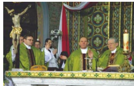
W kościele Zwiastowania NMP Kardynał Józef Glemp odprawił koncelebrowaną mszę św. w intencji Inowrocławia.