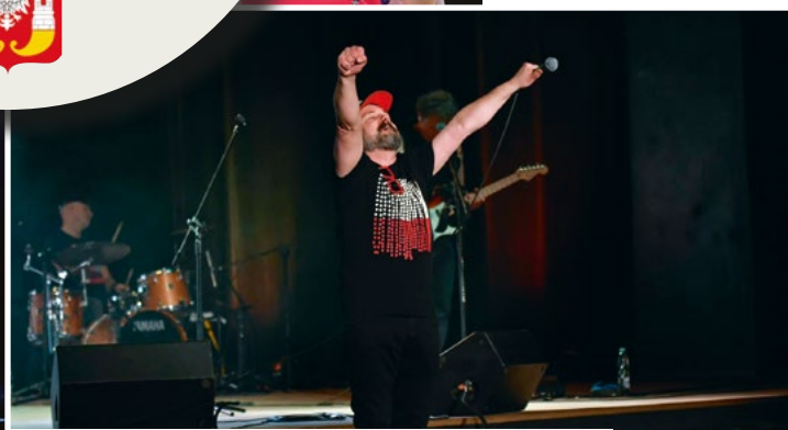
■ Arek Jakubik w koncercie „Chory na Polskę”