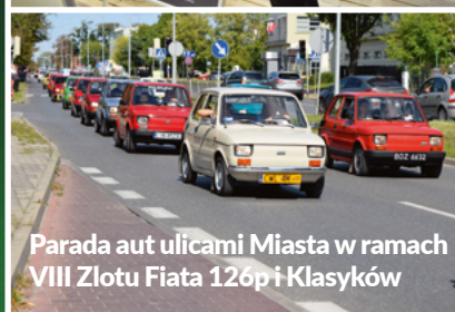
Parada aut ulicami Miasta w ramach VIII Złotu Fiata 126p i Klasyków