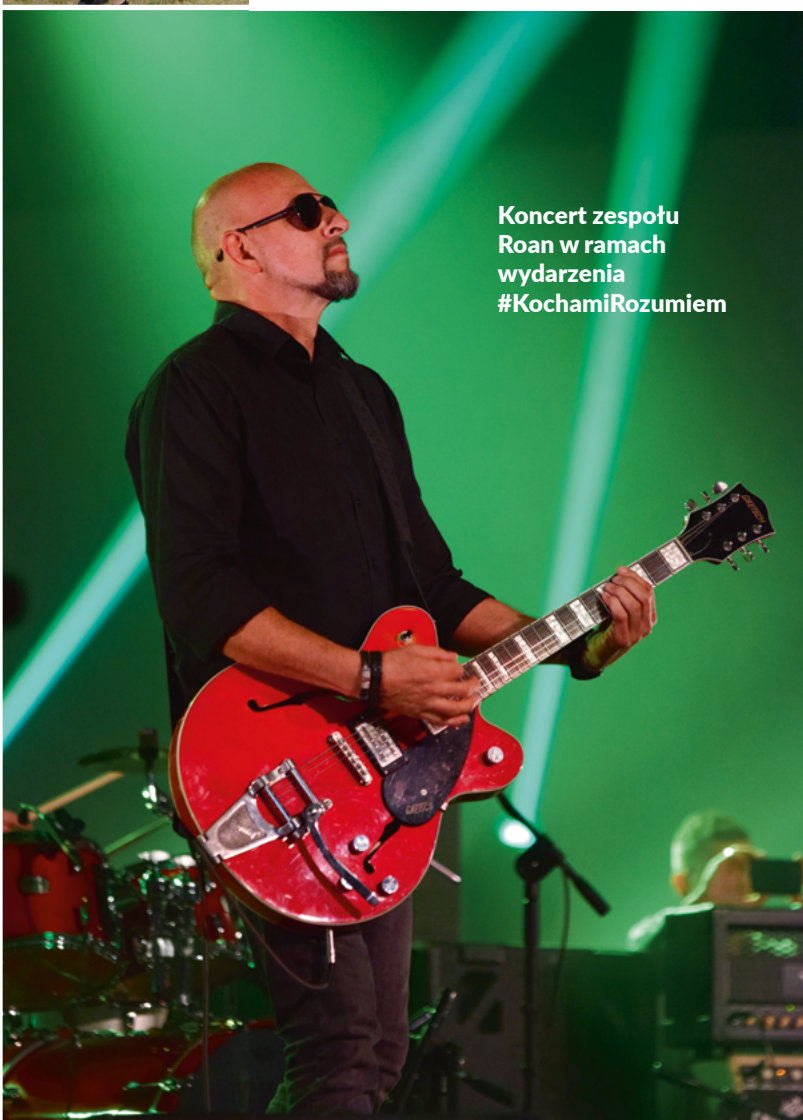
Koncert zespołu Roan w ramach wydarzenia #KochamiRozumiem