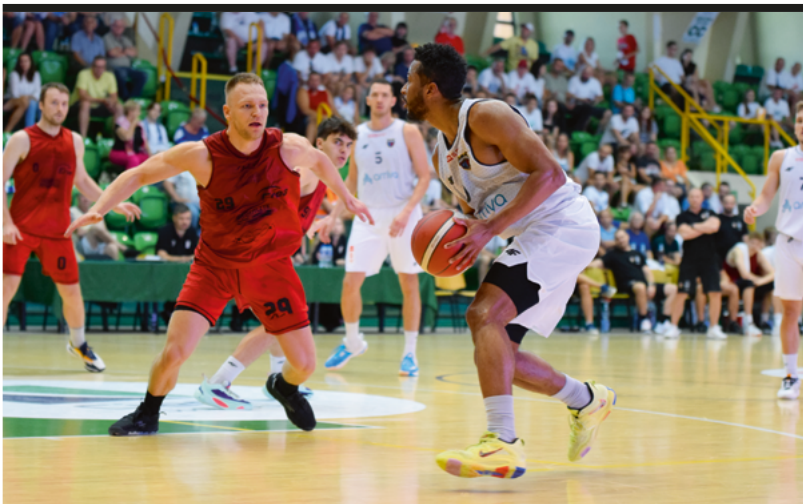
I Turniej o Puchar Marszałka Województwa Kujawsko-Pomorskiego