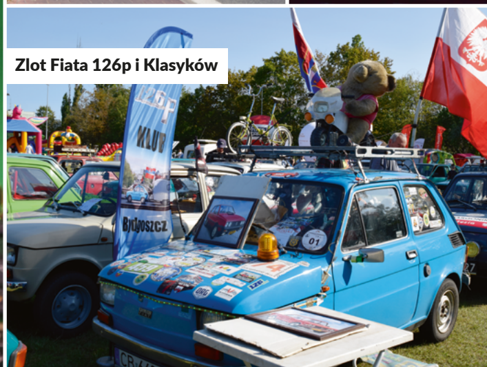
Złot 126p i Klasyków