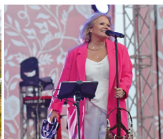
Dożynki Województwa Kujawsko-Pomorskiego