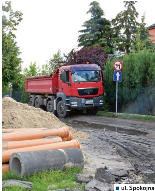
■ ul. Spokojna