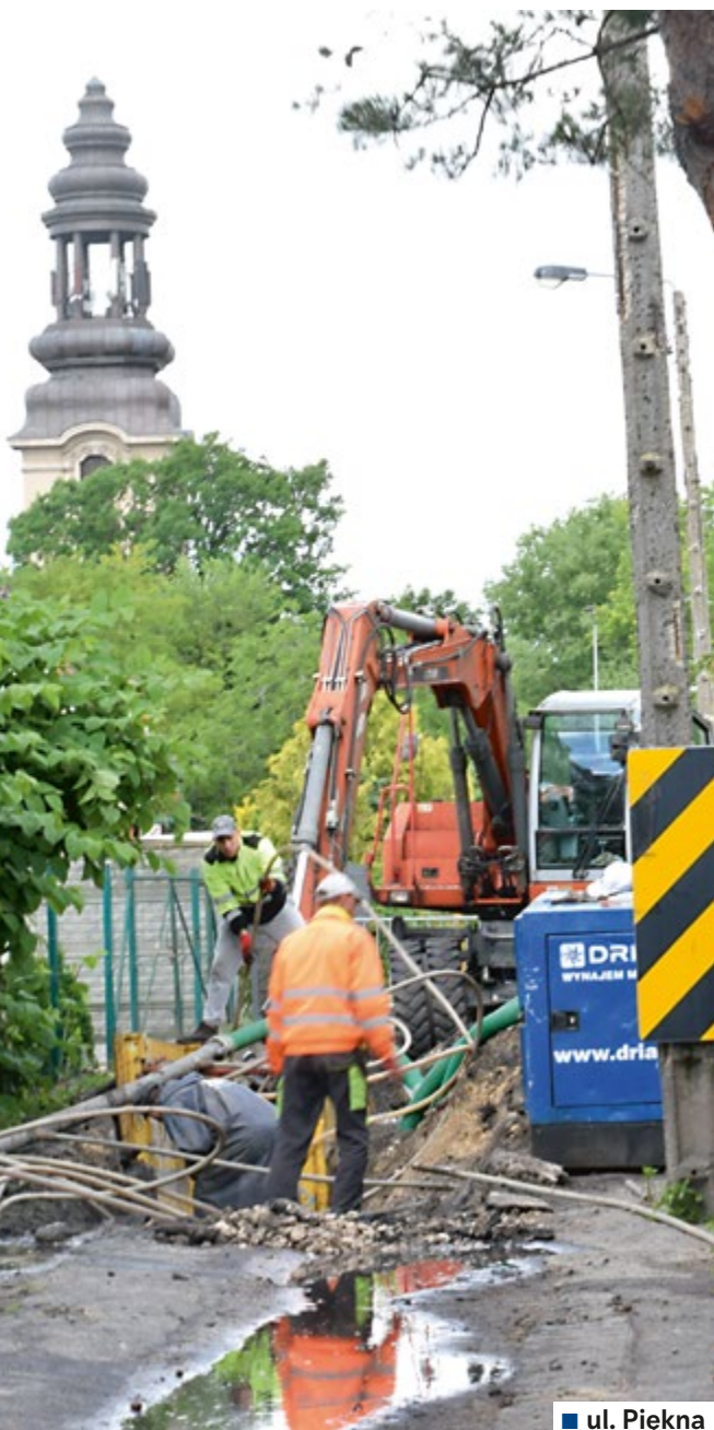
■ ul. Piękna