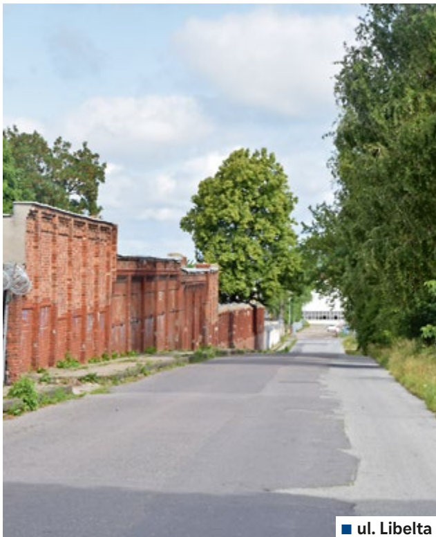
■ ul. Libelta